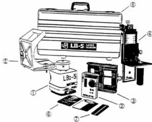
SISTEMA DE LASER LB-5